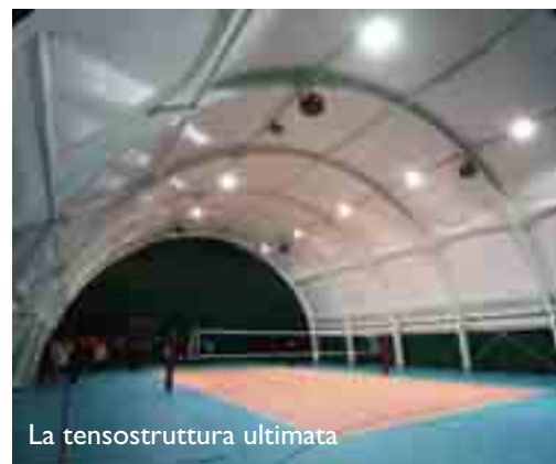
La tensostruttura ultimata

P rocede il percorso avviato dall'amministrazione comunale per dotare le nostre società di un'adeguata impiantistica sportiva. Dopo la ristrutturazione del palasport Massimo Serenelli, si è proceduto alla realizzazione di una nuova tensostruttura che andrà ad ampliare gli spazi a disposizione del volley e degli altri sport del territorio. L'opera per la quale sono necessari ulteriori lavori di dettaglio ha impegnato le casse dell'amministrazione per 150.000 euro.