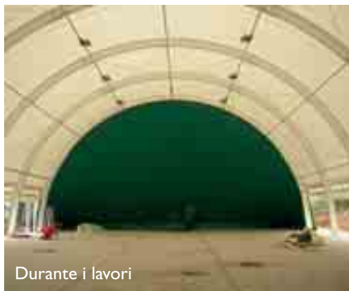
Durante i lavori

P rocede il percorso avviato dall'amministrazione comunale per dotare le nostre società di un'adeguata impiantistica sportiva. Dopo la ristrutturazione del palasport Massimo Serenelli, si è proceduto alla realizzazione di una nuova tensostruttura che andrà ad ampliare gli spazi a disposizione del volley e degli altri sport del territorio. L'opera per la quale sono necessari ulteriori lavori di dettaglio ha impegnato le casse dell'amministrazione per 150.000 euro.