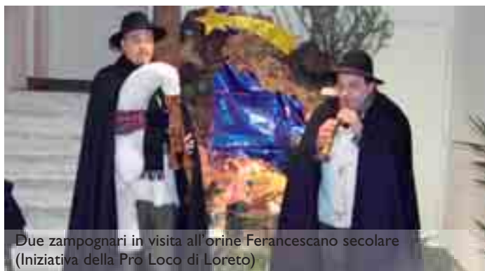
Due zampognari in visita all'ordine francescano secolare (Iniziativa della Pro Loco di Loreto)