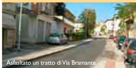
Asfaltato un tratto di Via Bramante