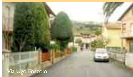
Via Ugo Foscolo