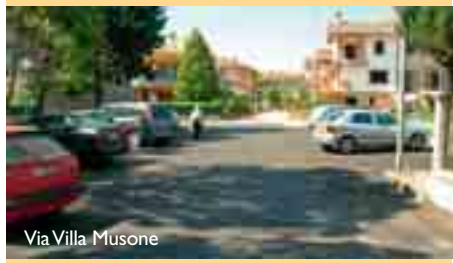
Via Villa Musone

Eseguite diverse asfaltature nella Zona di Villa Musone: Traversa Via Villa Musone, Via Ariosto e Via Foscolo